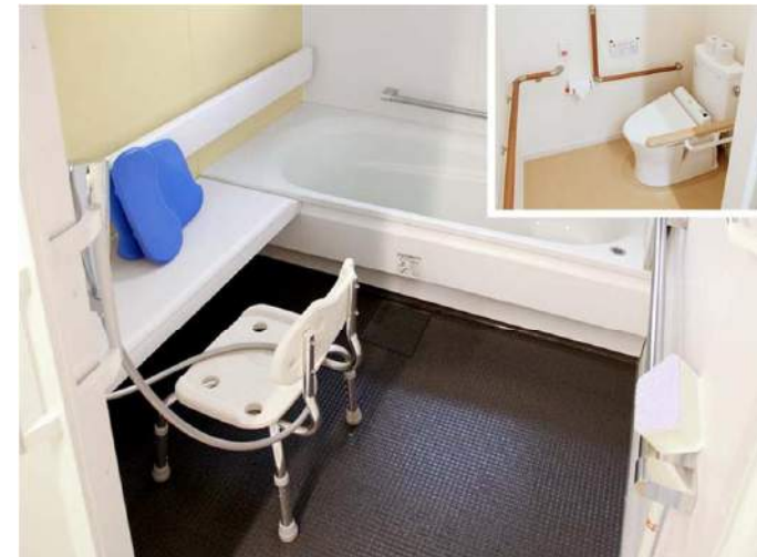
一般浴室には、ベンチタイプのユニットバスを採用。ゆったりと腰掛けてシャワー浴を楽しむことができ、ベンチに腰掛けたままバスタブに移動することもできる。各浴室にはトイレを併設している。