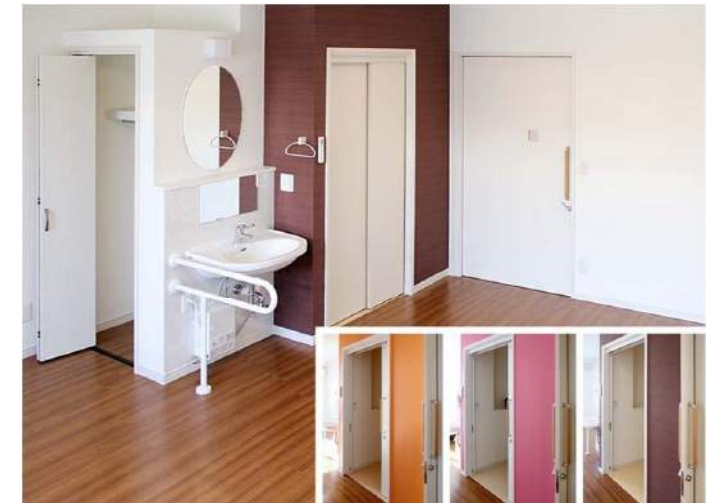
各居室には、トイレと洗面所、クローゼットを備えている。トイレまわりの壁紙の色を変えることにより、空間のアクセントとして各部屋に変化を持たせている。