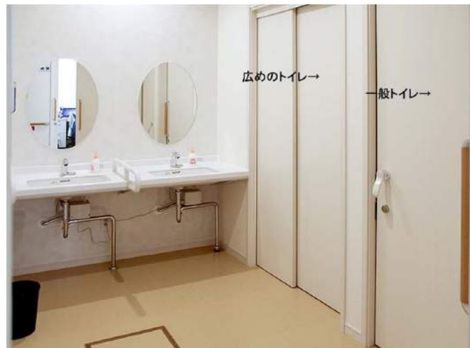
洗面カウンターは、車いすでアプローチしやすい薄形カウンターを採用し、水栓金具は衛生面に配慮して、自動水栓を設置。一般トイレのほか、介助スペースを確保した、広めのトイレを1ヶ所用意している。