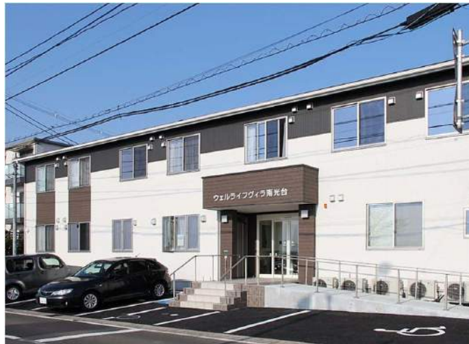
ウェルライフヴィラ南光台は、仙台市のベッドタウンとして発展した泉区に立地。夫婦部屋2部屋を備えた計27室のサービス付き高齢者向け住宅。