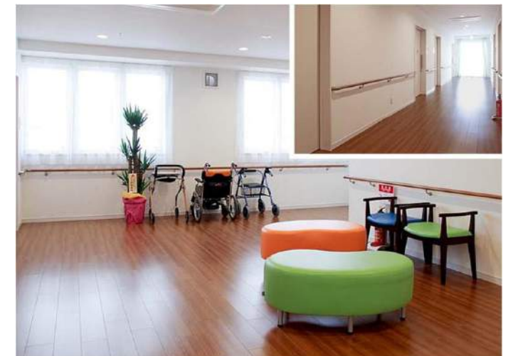
入居者同士の交流スペースとなるオープンな談話コーナー。地域の方々にも活用してもらうことを想定し、広々としたスペースを確保している。