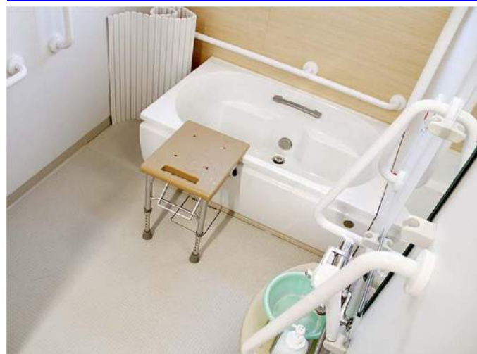
介護浴室には、介護用のユニットバスを採用。シャワーキャリア(入浴用チェア)で入室でき、介助スペースも確保されている。