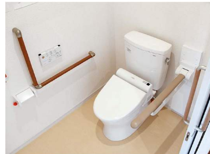
安全面に配慮して、座位の安定や立ち座りをサポートする、はねあげ手すりL型手すりを設置。また、緊急用として呼出ボタンも設置している。