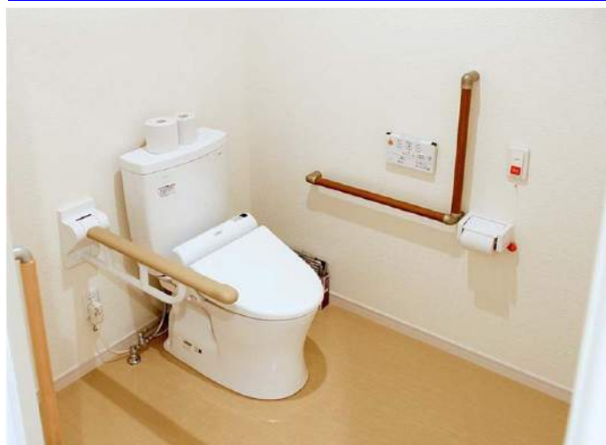
便器前方と側方に介助スペースを確保した広めのトイレ。ウォシュレットと手すり、また緊急用として呼出ボタンを設置している。