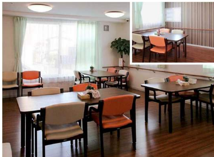
コミュニティリビング(食堂)は、椅子の色や壁紙の色にこだわり、楽しさと、くつろぎを演出。入居者同士の交流の場や、地域の方との交流の場としても活用されている。